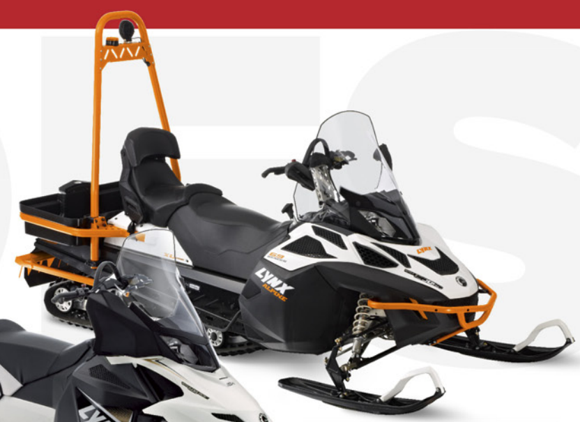
69 Ranger™ Alpine™