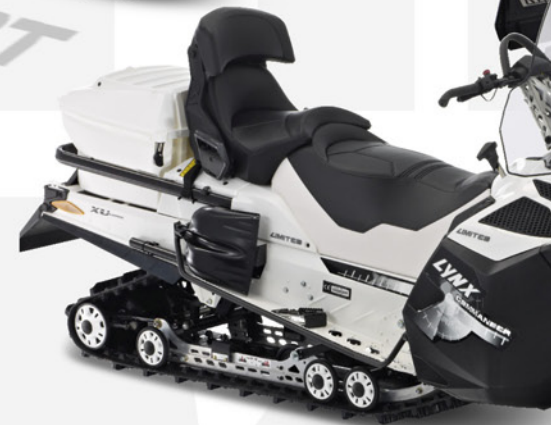
Xtrim™ Commander™ 600 E-TEC Xtrim™ Commander™ Limited 600 E-TEC