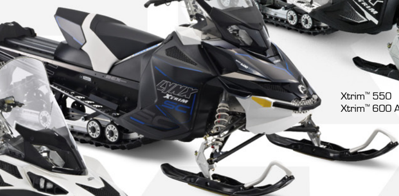
Xtrim™ SC 600 E-TEC