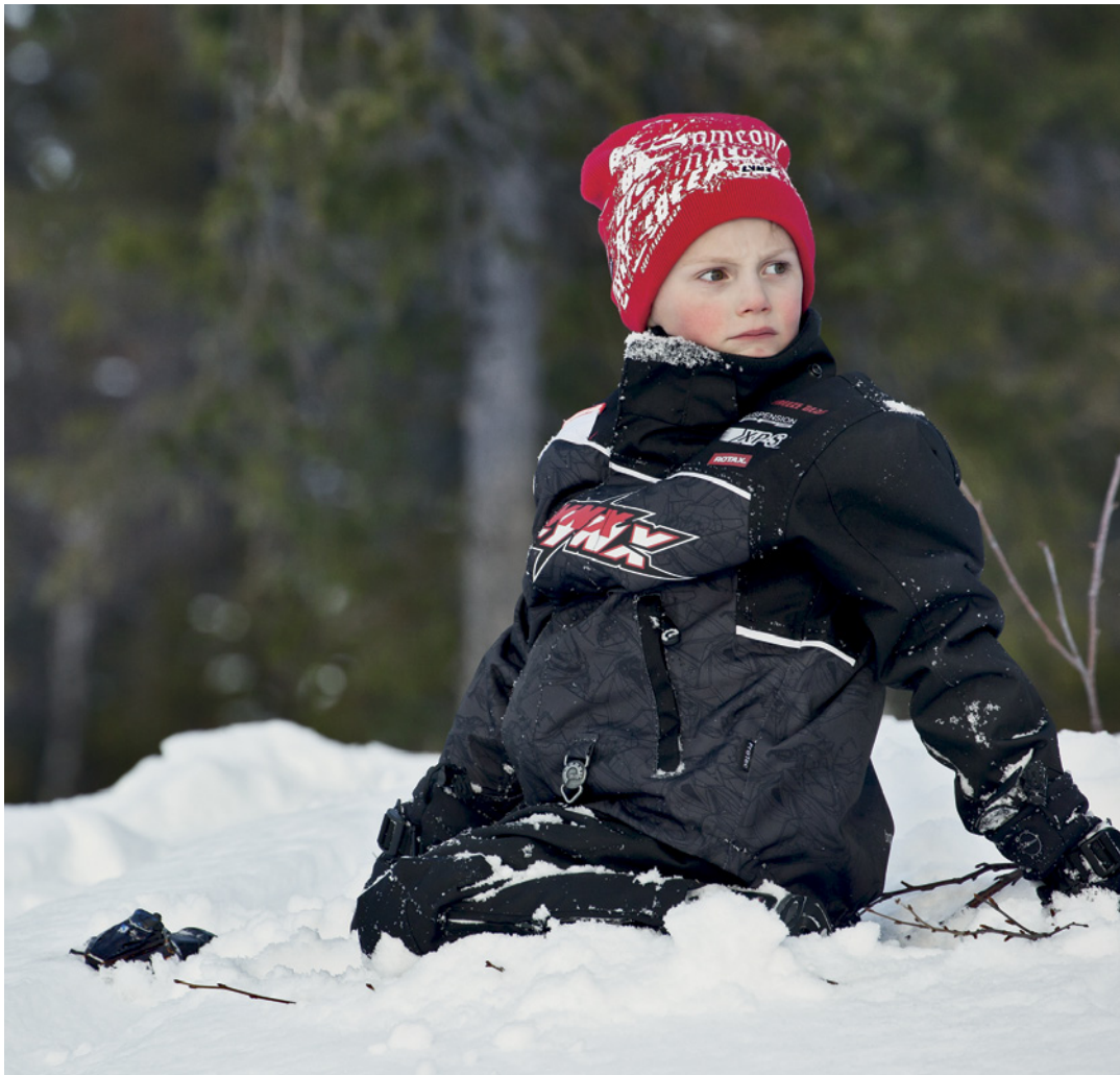
Barns Chena Suit 657002_90 • 2 - 6

Foder: Thermal Loft Goda andningsegenskaper, vind- och vattentät. Vatten- och smutsavvisande Teflonbehandling. Tejpade sömmar. Varm löstagbar huva. Justerbar i muddar och midja. Längden på byxorna kan justeras.