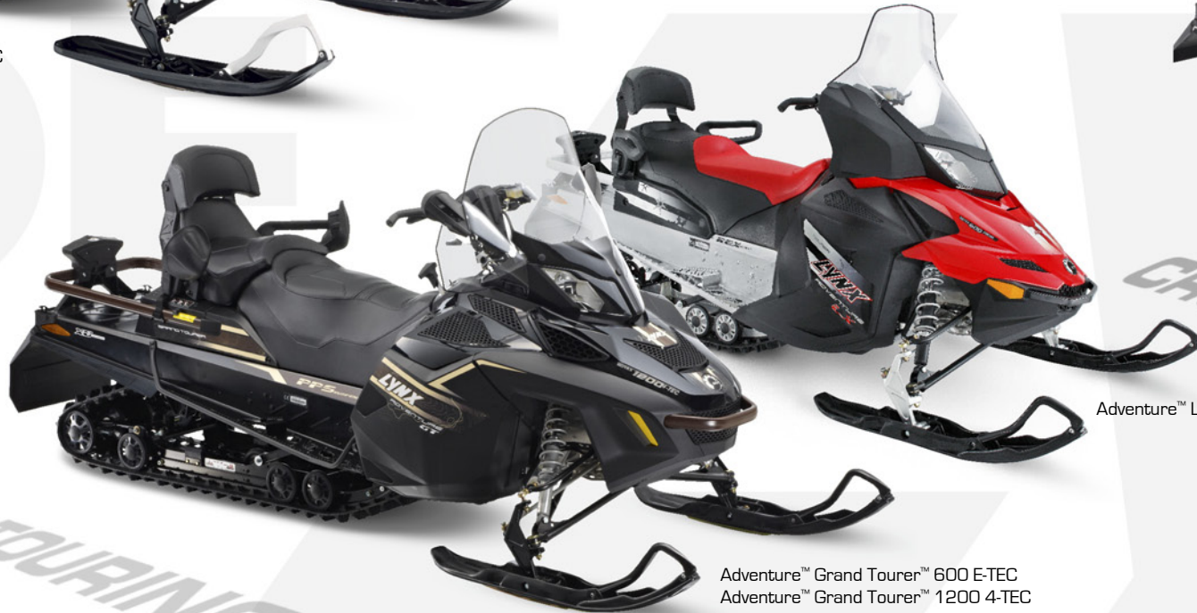
Adventure™ LX 600 ACE