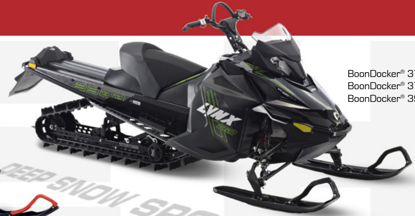
BoonDocker® 3700 600 E-TEC BoonDocker® 3700 800R E-TEC BoonDocker® 3900 800R E-TEC