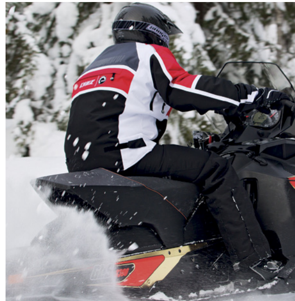
Valdez Jacka 650077_90 • XS - 4XL

Aramid fibre helmet for Lynx riders. ECE 2205 approved. Removable and washable cheek and head pads. Double D racing buckle. Weight 1250 g.