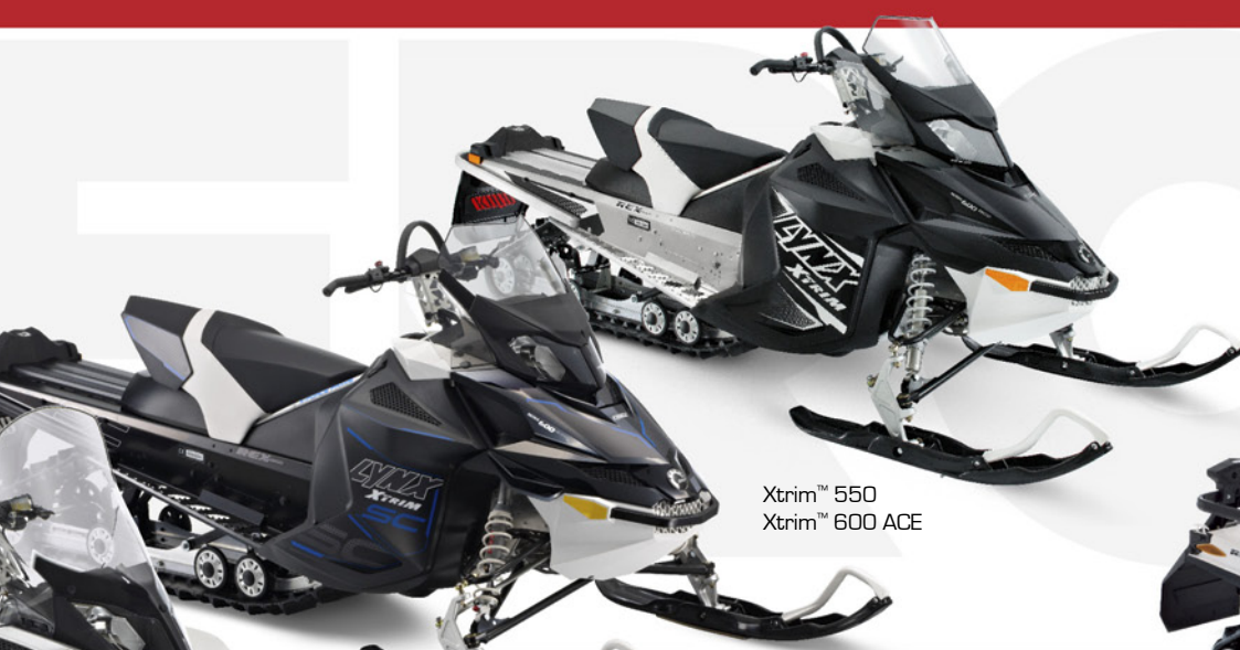
Xtrim™ 550 Xtrim™ 600 ACE