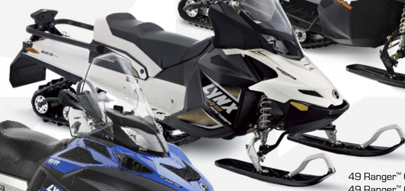
49 Ranger™ 600 ACE 49 Ranger™ 600 E-TEC