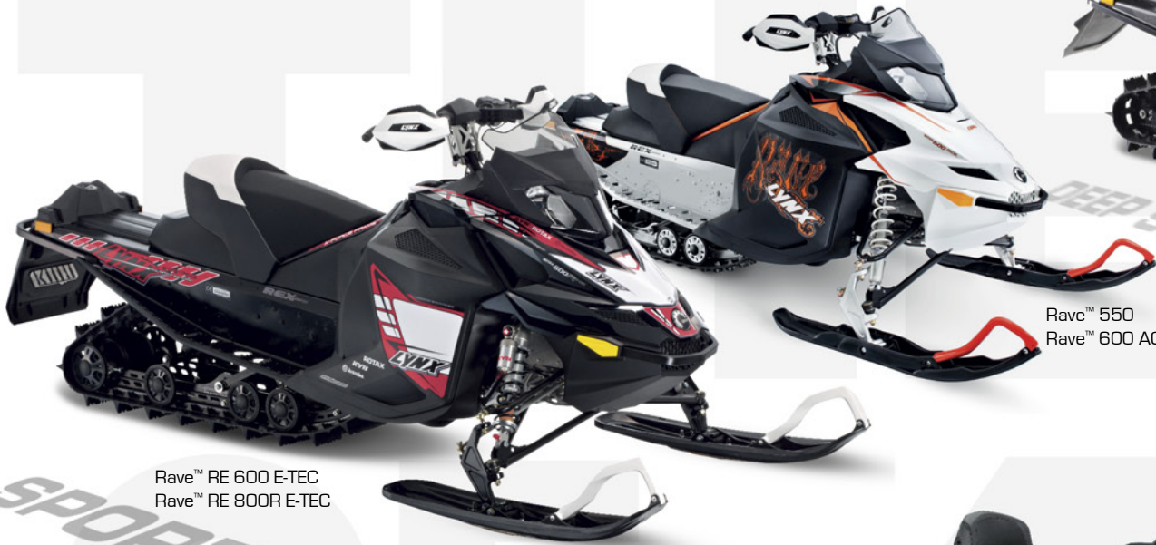
Rave™ RE 600 E-TEC Rave™ RE 800R E-TEC